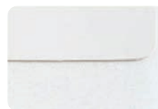
Étiquettes dotée de la technologie Clean Liner

Pour un résultat garanti, nous conseillons toujours l'utilisation des étiquettes CLT avec notre gamme d'applicateurs PAM.